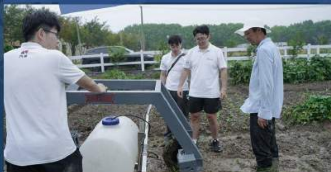
Ceres集约设备在蒙田农场为农民进行全流程作业